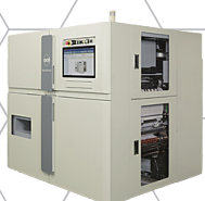
Océ MonoStream 500