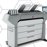
Océ ColorWave 700