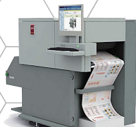
Océ VarioStream 7170