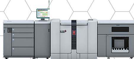
Océ VarioPrint 6320 Ultra+