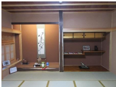
復元された槐（えんじゅ）の間