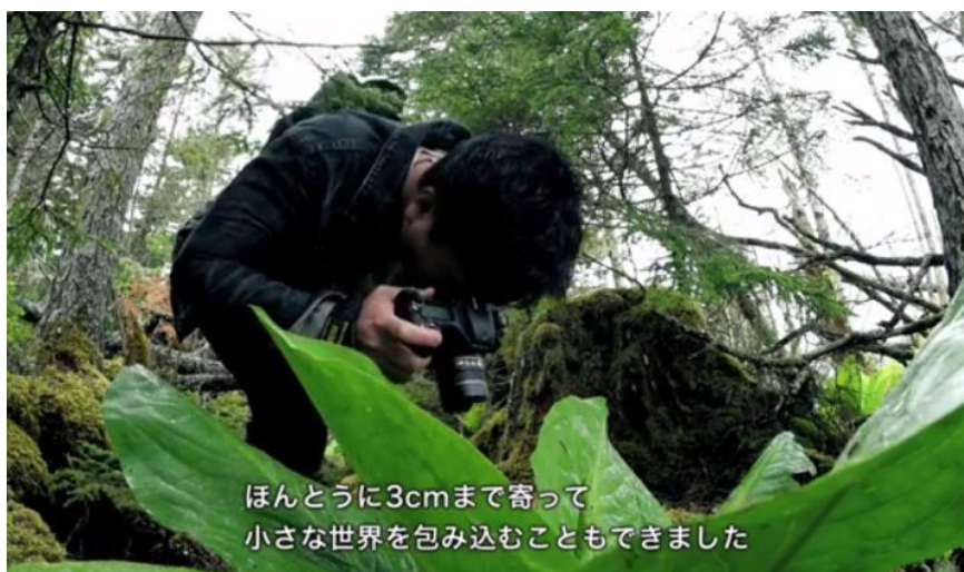
「動画内にて撮影の様子を紹介」