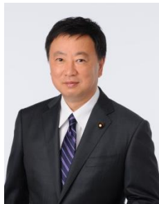
松野 博一 文部科学大臣