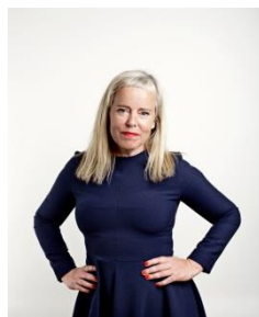
キッグ・ヴィッド INDEX: Design to Improve Life® CEO