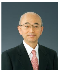
酒井 隆明 篠山市長(兵庫県)