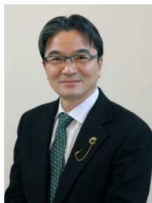
宮田 亮平 文化庁長官