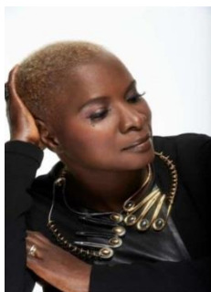
アンジェリーク・キジョー 音楽家、バンド