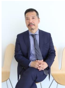
秋元 雄史 東京藝術大学大学美術館館長・教授、金沢21世紀美術館館長