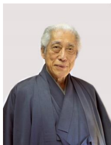
千 玄室 裏千家十五代・前家元 ユネスコ親善大使 日本・国連親善大使