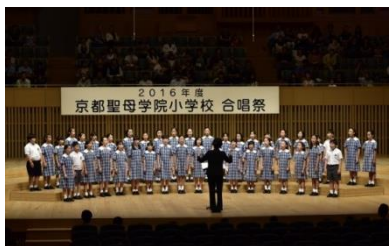
京都聖母学院小学校(合唱)