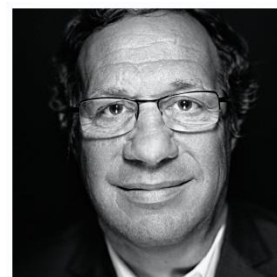
フランシス ガーベット オリンピック文化遺産財団理事長