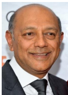
アナント・シン 映画監督、プロデューサー