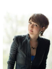
スプツニ子! 現代美術家 マサチューセッツ工科大学 メディアラボ助教