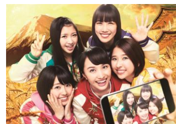
ももいろクローバーZ