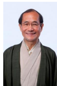
門川 大作 京都市長(京都府)