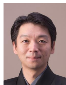
茂山 逸平 大蔵流 狂言師