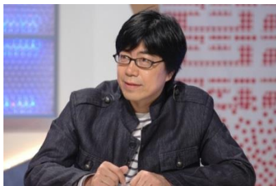
中谷 日出 NHK解説委員