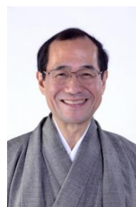
門川 大作 京都市長