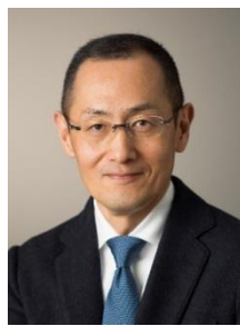
山中 伸弥 京都大学iPS細胞研究所 所長 / 教授