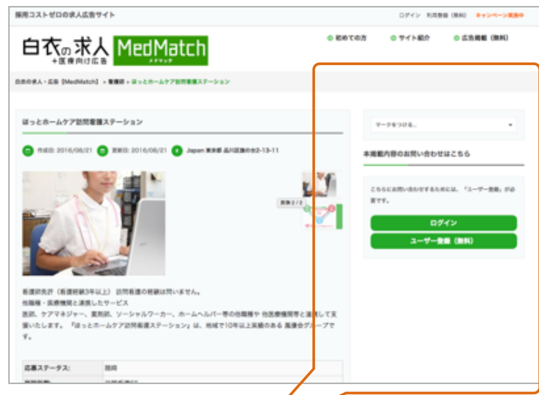
ログインしていない状態