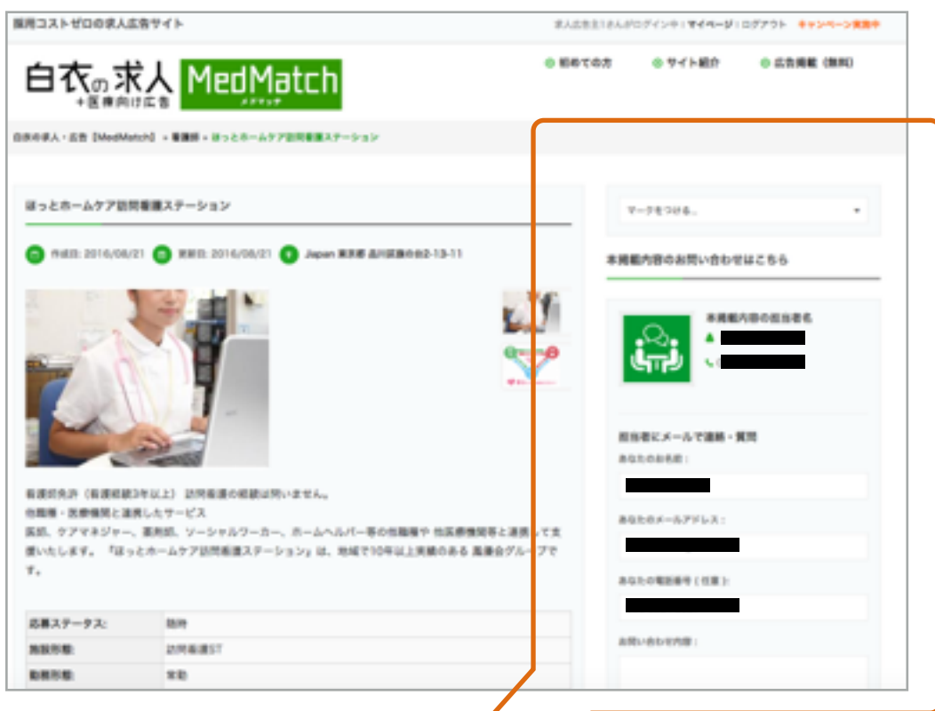
ログインすると 採用担当の連絡フォームが表示されます