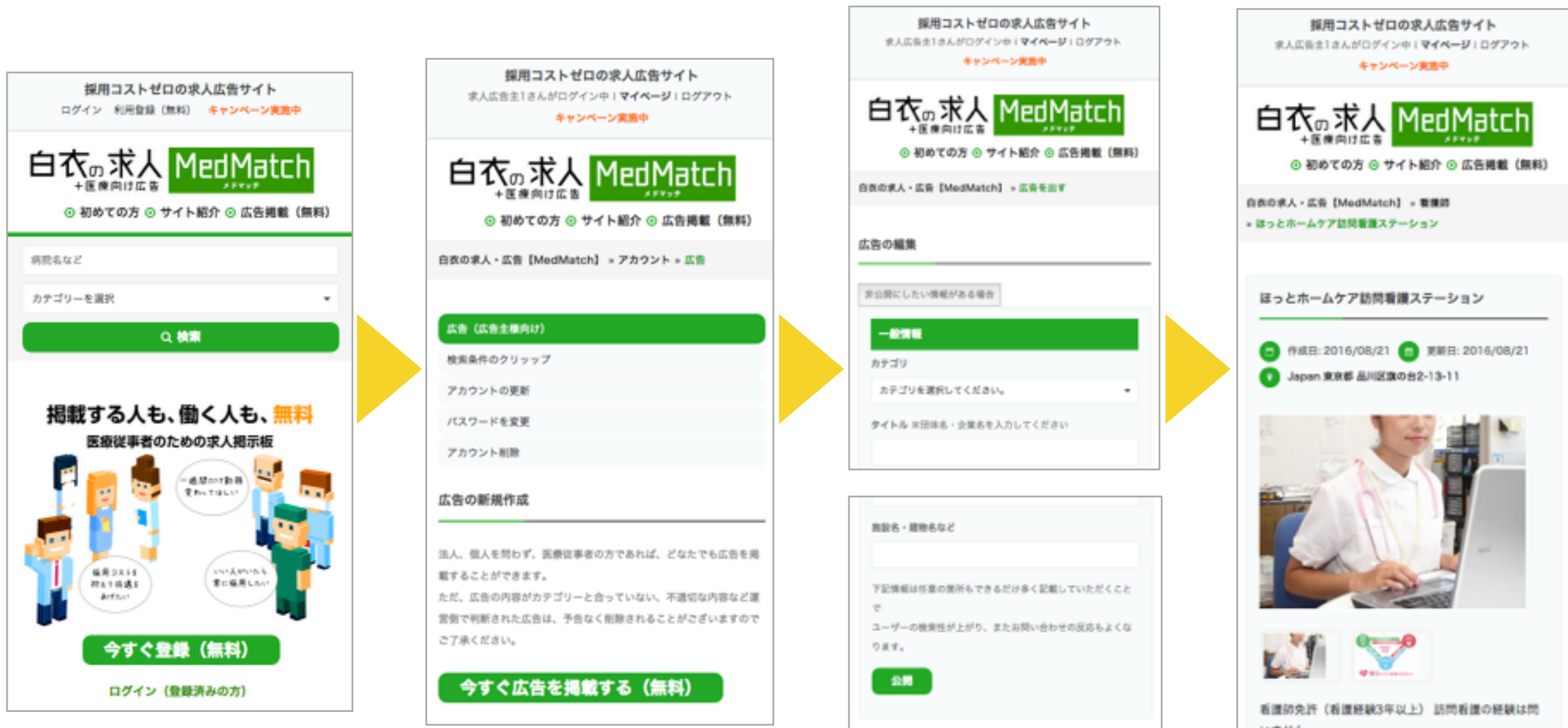
① 利用登録 (無料)