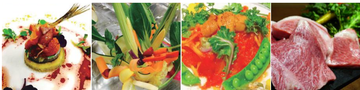
色とりどりの前菜 自慢のバーニャカウダ 旬の食材を使ったパスタ 厳選されたブランド牛

「オラエ」とはイタリア語をルーツとした言葉で「さあ、今このひとときを楽しんで そして人生を豊かに」という意味が込められています