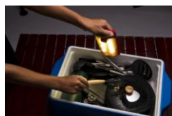
暗闇で探しモノをする時に