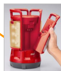
本体に戻せば、自動的に充電を開始!