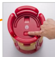
本体と分割式エアライトのスイッチで、High/Low/Off が可能