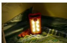
テント内のフットライトに