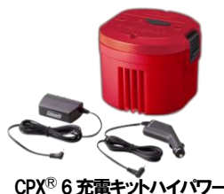
CPX® 6 充電キットハイパワー