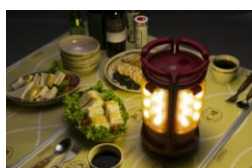
単体でテーブルランタンに