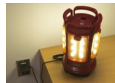
AC パワーパックなら室内灯として