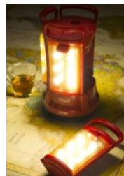
アンバーレンズ使用で、LED 特有のまぶしさを軽減