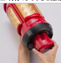
CPX® 6 充電キットハイパワーを使用すると、より長時間の連続使用が可能