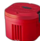
CPX® 6 充電式カートリッジハイパワー