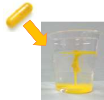
液体ウコンカプセル製法

微細化し吸収力を高めた「微細吸収型クルクミン」と、体内で持続する「バランス吸収型クルクミン」を 15mg ずつ、計 30mg 配合。 これら 2 つのクルクミンを液体カプセル製剤にすることで、「クルクミン」の品質を安定させました。1 粒で目安量 30mg の「クルクミン」がお摂りいただけます。また、これらの 2 種の「クルクミン」30mg の 1 粒化の処方の特許を出願しております。