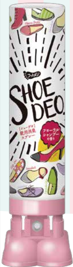
フローラルシャンブーの香り

足元のオシャレと一緒に気を遣いたいのが、靴のニオイ対策。しかしお出かけ前は何かとバタバタしてしまい、消臭ケアを忘れがちな人も少なくありません。「シューデオ」は、玄関先に置いて恥ずかしくないオシャレなデザイン。玄関先で毎日忘れずにケアができます。そして、靴の中に入れて押すだけなのでカンタン。ニオイが出やすい“つま先”まで靴をさわらずにスプレーできます。また、靴用スプレー独特のきつい香りではなく、リラックスできるやさしい香りを採用。無香料タイプもご用意しました。もちろん、最も重要な除菌&消臭効果は実証済み。ヒールや革靴はもちろん、カジュアルなスニーカーやブーツにも使える「シューデオ」で、靴ケアをもっとさわやかに、ファッションブルに楽しみませんか？