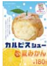
今夏限定! ビアドパバと コラボシューを新発売!