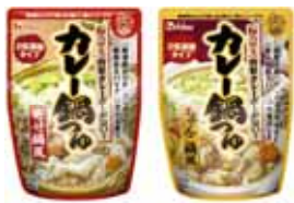
数々の賞を受賞したヒット商品! ハウス食品とのコラボ企画 ※2008年開発当時のパッケージ

このときの商品開発の経験とアンケートから、『サンキュ!』では主婦と企業がコラボレーションする商品開発(コラボ商品)が注目される理由について、独自の分析を行いました。