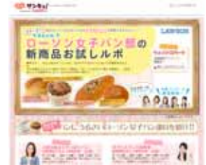
“ローソン女子パン部”の定例試食会レポートを公開中

ロコミサンキュ!「ローソン女子パン部」 http://39.beness.ne.jp/housekeep/cmp/tu/120604lawson/