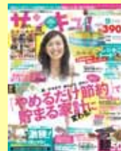
サンキュ!9月号(8/2発行)

【調査概要】 ●実施期間:2012年7月3～9日 ●調査方法:インターネット調査 ●調査対象:20～40代の主婦159名(ベネッセコーポレーションが運営するwebサイトロコミサンキュ!より)