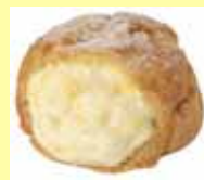
カルピス®シュー つぶつぶ夏みかん

この発売を記念して、コラボシュークリームを開発した『サンキュ!』主婦ブロガーが考案したエコバッグ〈レジかごトート〉を、サンキュ!9月号(8月2日発行)で応募者全員にプレゼントするキャンペーンを実施中です。