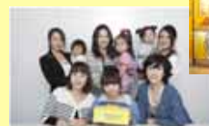
サンキュ!人気ブロガーとビアードパパが共同開発