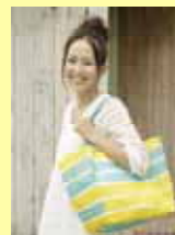
人気ブロガーが考案したレジかごトート