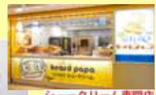
シュークリーム専門店ビアードパパで販売