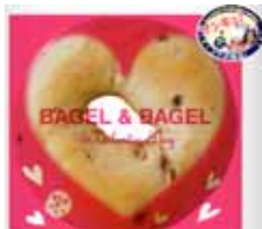
約2倍に売上アップ! ベーグル&ベーグルとの コラボ企画