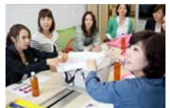
主婦ブロガーが座談会に参加し 商品開発のアイデアを出し合う

また、主婦の声を商品開発に活かすだけでなく、主婦とのコラボ企画であることの魅力付けや、ブログやSNSでの発信力を活かした告知や宣伝効果も期待されています。特に、『サンキュ!』の読者ブロガーはそれぞれ料理やファッション、インテリアなどの得意分野を持ち、各ジャンルでの情報発信力が強く、ロコミによる影響力が強いのも、『サンキュ!』読者主婦との商品開発の魅力になっているとのこと。