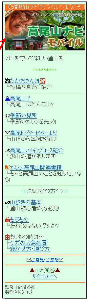
『高尾山ナビモバイル』TOP