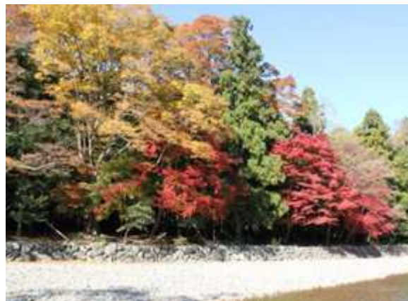
伊勢神宮 内宮(三重県)

2位は、三重県の「伊勢神宮 内宮」。クチコミでは「参道は深い森につつまれ、歩いていると静かで神々しい空気を感じる」「歩きながら浄化されていくような気がした」「紅葉の季節は特におすすめ」といったコメントがみられた。隣接する「おかげ横丁」も観光スポットとして人気があり、あわせて散策を楽しむ人の多いことも伺えた。