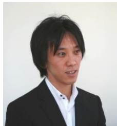
GMOインターネット株式会社 システム本部 サービス開発部ドメインチーム

現在は、GMOインターネットで、「お名前.com」のバックエンドシステムを担当するエンジニアとして活躍している。