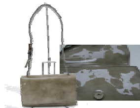
プラダ ショルダーバッグ 落札金額:1,575円