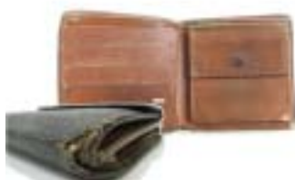
ルイ・ヴィトン 二つ折り財布 落札金額:3,000円