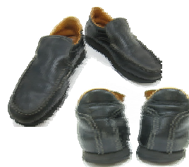
エルメス シューズ 落札金額:9,068円