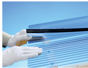
屋根材の防水補修に