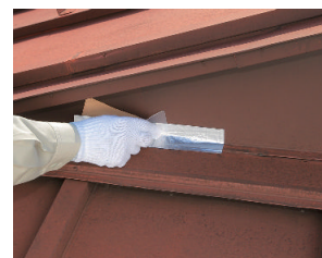
屋根材の防水補修に