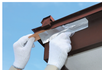
屋根材の継ぎ目の防水に