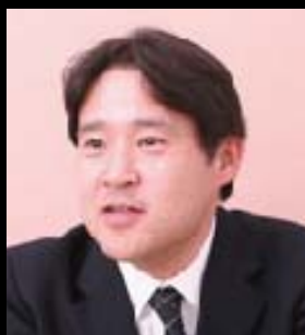
消費者相談実績 2500件 住宅コンサルタント