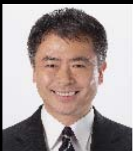
民主党 政策審議会会長