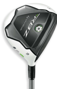
Women's 【RBZ フェアウェイウッド】