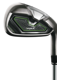
Women's 【RBZ アイアン】