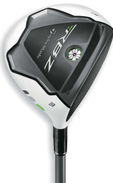
【RBZ フェアウェイウッド】