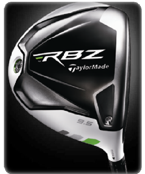
【TaylorMade RocketBallz ドライバー】 (2012年2月24日発売予定)