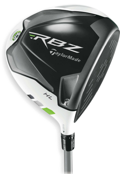
Women's 【RBZ ドライバー】

Women's『TaylorMade RocketBallz』シリーズでは、40g 台の軽量設計シャフトを採用し、軽快で速いスウィングを実現。大きなフェースでミスヒット時でも真っすぐ安定した飛びを提供し、女性ゴルファーでも安心できるゴルフスタイルを提案します。