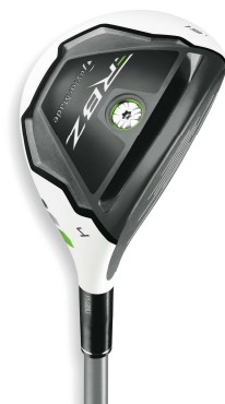
Women's 【RBZ レスキュー】