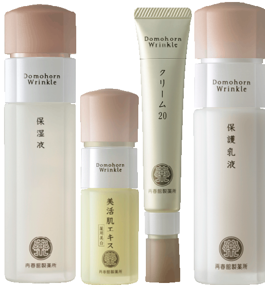
③保湿液 ④美活肌エキス 薬用美白 ⑤クリーム20 ⑥保護乳液

もっとお肌の悩みの根本へ。 悩みに立ち向かうお肌のちからを 基本4点の総合力で引き出す。