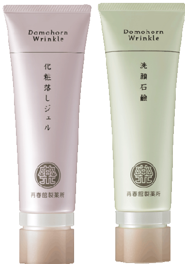
①化粧落としジェル ②洗顔石鹸

より優しく、素早く、確実に。 お肌をいたわりながら 負担のかかる汚れをきちんと落とす。