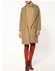
シェビオットオーバーコート 19,990 JPY