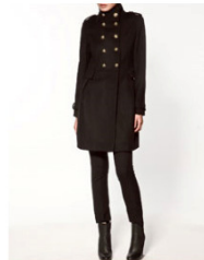
ダブルオーバーコート 15,990 JPY