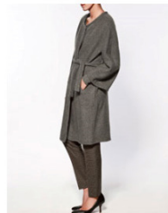
ス튜디오ベルトコート 47,990 JPY