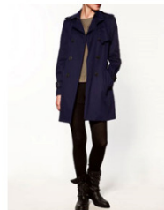
NEW ダブル プレストッド レインコート 10,990 JPY