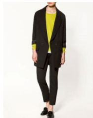
ダブルオーバーコート 19,990 JPY