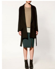
ベルトオーバーコート 19,990 JPY