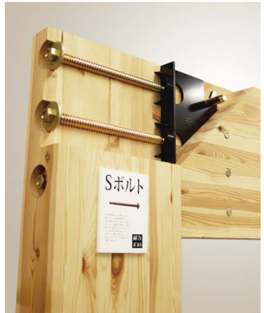
【写真：全棟採用したSボルト】

一般の普通ボルト（半ねじタイプ）の曲げ剛性に対して、Sボルトは、従来のSE構法よりも最大2倍もの曲げ剛性を