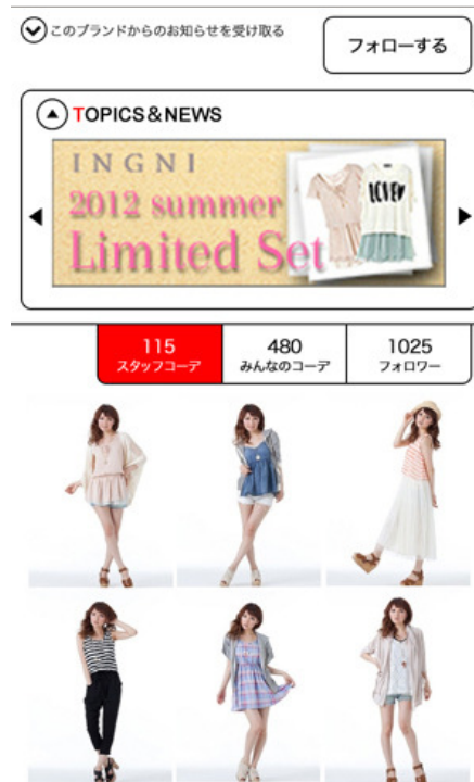
アパレルブランド側では店員のコーデ画像をアップ、情報配信も可能