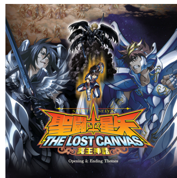
▲ CD ジャケット

巨匠“車田正美”が自ら作詞を手掛けた「花の鎖」、伝説のバンド“EUROX”が書き下ろした渾身の「The Realm of Athena」、カラオケとフルバージョンも収録した聴き応えのある主題歌集！