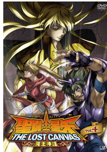
▲ Vol.4 DVD ジャケット