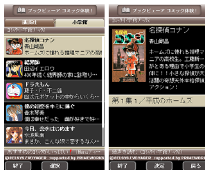
(C) 青山剛昌・田辺イエロウ・藤子・F・不二雄・