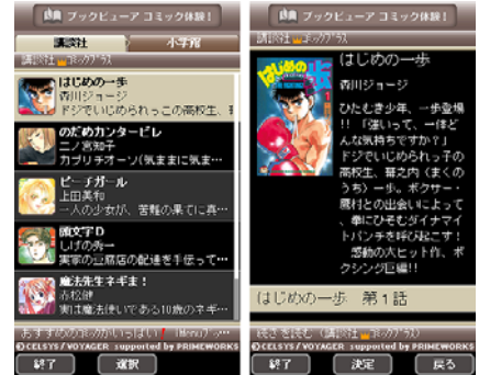
(C) 森川ジョージ・二ノ宮知子・上田美和・