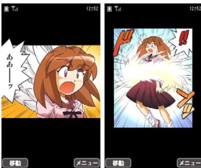
まひるの天使 (C) いのうえこうじ/セルシス