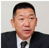
一般財団法人東京保健会 病体生理研究所 事務長