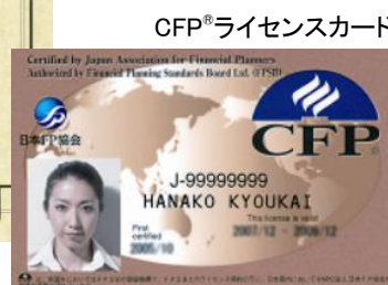
CFP®ライセンスカード

※ CFP®、CFP®、CERTIFIED FINANCIAL PLANNER®、およびサーティファイド ファイナンシャル プランナー®は、米国外においては Financial Planning Standards Board Ltd.(FPSB)の登録商標で、FPSB とのライセンス契約の下に、日本国内においては NPO 法人日本 FP 協会が商標の使用を認めています。