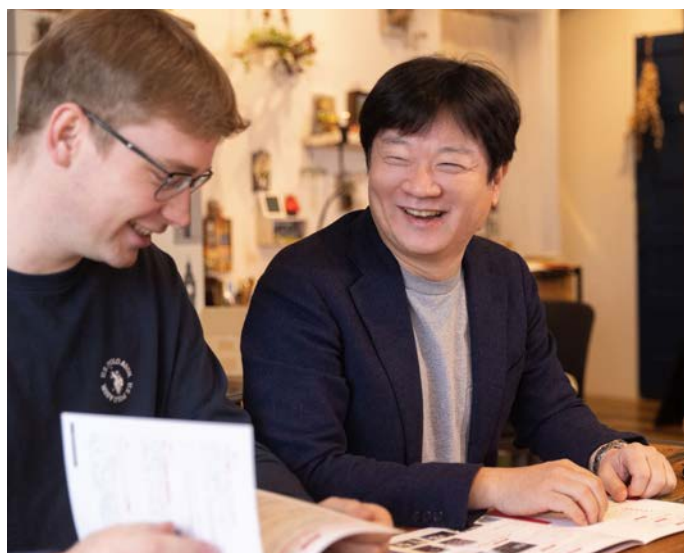
株式会社スリーハイ

今回の出資を機に成長分野への投資を実施することで、横浜から日本の製造業を復活させ、多くの製造業を牽引していきたいと考えています。