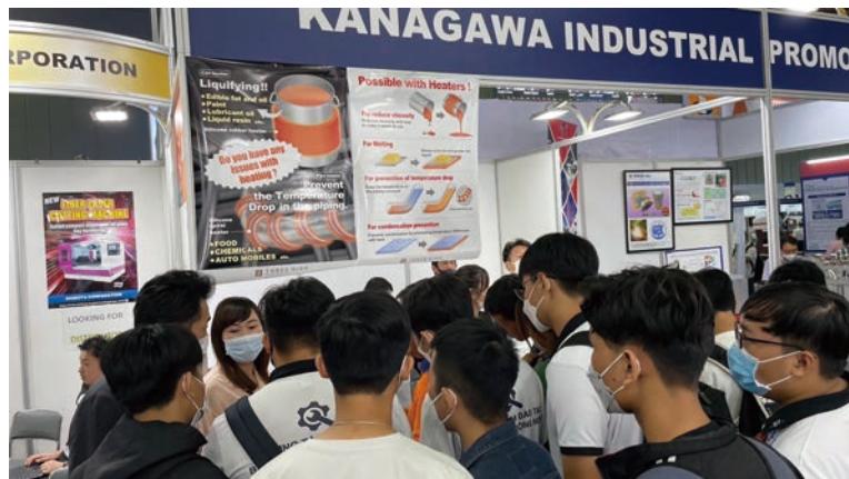
タイ及びベトナムでの展示会に出展した様子