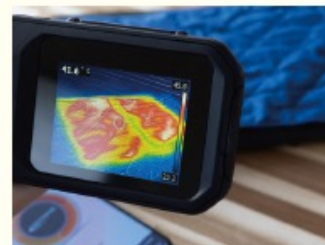
特許技術を活用した布状ヒーター「& FIBERS」

また、事業活動から発生する環境負荷軽減にも取り組んでいます。具体的には、2019年より、原材料や資材を受け取る段ボール箱を、当社製品の納入に再利用した結果、 2022年の段ボール購入費は、前年比-66%となりました。