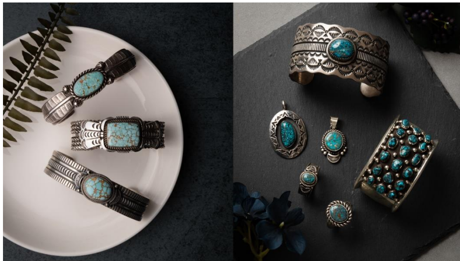
LFC JAPAN で販売されている商品の一例