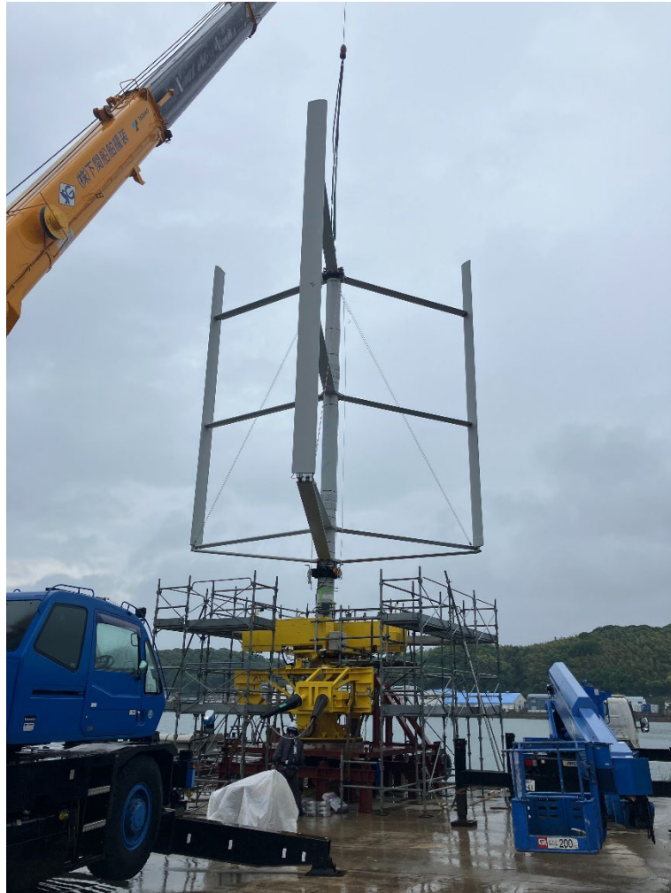
浮遊軸型風車（FAWT）小型実験機 陸上試験