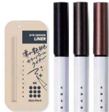
パッケージ:新デザイン採用・サイズは現行品同様(容器除く)

ただのパールアイライナーじゃない ただの定番色のブラック系・ブラウン系でもない 定番色にもトレンドがある はつきりしているのに、抜け感の演出で 今っぽい、映えメイク完成