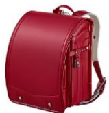
カーマインレッド