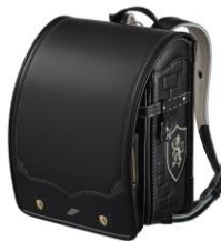
ブラック×ゴールド

【商品名】モデルロイヤル アリス 【価格】70,000円、73,000円（税別） 【カラー展開】4色 【特長】カブセには「リボンステッチ」、サイドには「お城の窓」をイメージした刺しゅうを施し、「不思議の国」に入り込んだようなファンタジックな世界を表現。