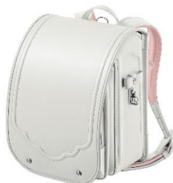
NEW ジュエルホワイト

【商品名】ココ シャルム 【価格】73,000円～（税込価格 80,300円～） 【カラー展開】10色 【特長】やわらかなドレスのような上質さにこだわったモデル。 ニュアンスカラーをベースに、丸みのあるフォルムにリボンを添えた大人かわいいデザインが特長です。