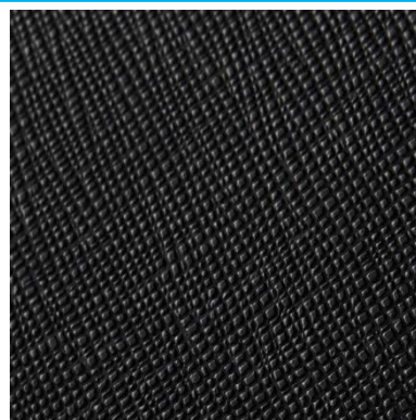
アンジュエール クレヴァス