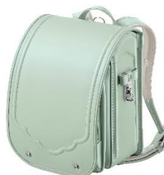
NEW ルナピスターシュ