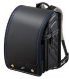
ブラック× マリンブルー