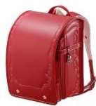
カーマイン レッド