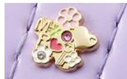
<カブセ部分のカシメ>