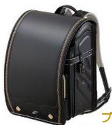
ブラック× ゴールド

ブラックをベースに、ステッチの色で変化をつけた全4色。シンプルで大人っぽい配色です。