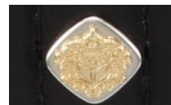
<カブセ部分のカシメ>