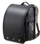
ブラック× マリンプルー