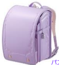
パステル パープル