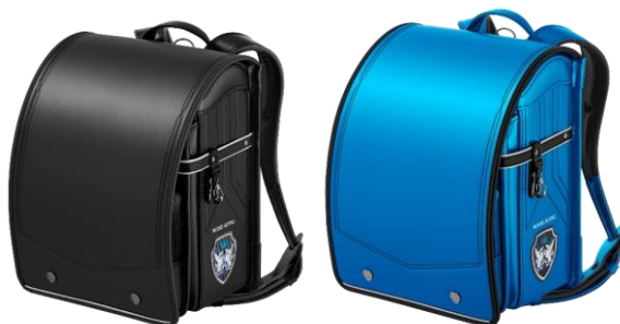
左から、ブラック、パールメタルマリン×ブラック ※パールメタルマリン×ブラックは直営限定カラー

【商品名】モデルロイヤル ドラグーン 【価格】65,000円 (税込価格 71,500円) ※パールメタルマリン×ブラックのみ 69,000円 (税込価格 75,900円)