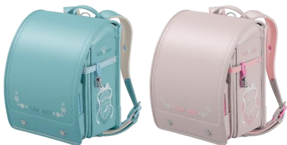
左からマーメイドグリーン×シャーベットミント、 ミルクティーベージュ×ベビーピンク

【商品名】モデルロイヤル クリスタル 【価格】65,000円 (税込価格 71,500円) 【カラー展開】9色 【特長】雪の結晶がキラキラと輝くまばゆい 世界観をガラスの靴や、宝石のような雪の 結晶などで演出したモデル。クリスタルガ ラスがキラキラと輝きます。