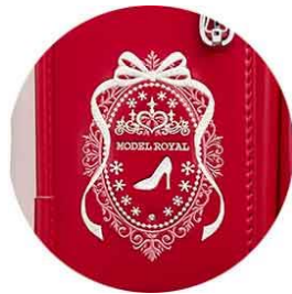
アプリ反応モチーフ サイドの刺しゅう

【商品名】モデルロイヤル クリスタル 【価格】63,000円(税別) 【カラー展開】6色