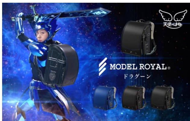
- モデルロイヤル ドラゴーン「騎士変身」篇 -

セイバンは、以前より独自の技術とノウハウで、お子さまとご家族が6年間毎日安心して快適に使用できるランドセルづくりを行って参りました。昨年のランドセル購入者のアンケート結果からも、ラン活をされるお母さまが“選ぶ時に重視したポイント”の1位が「丈夫さ」となる一方で、ラン活の主役であるお子さまは色やデザインといった見た目の部分に興味を示す傾向にあります。