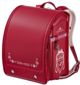
ビビッドピンク×ピーチピンク