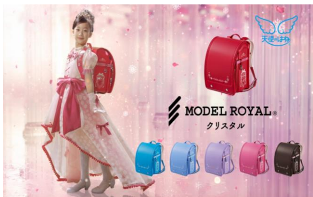
- モデルロイヤル クリスタル「お姫さま変身」篇 -