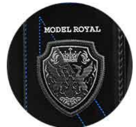
アプリ反応モチーフ サイドの刺しゅう

【商品名】モデルロイヤル ドラグーン 【価格】63,000円(税別) 【カラー展開】4色