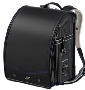
ブラック×マリンブルー

【商品名】モデルロイヤル クリスタル 【価格】63,000円(税別) 【カラー展開】6色