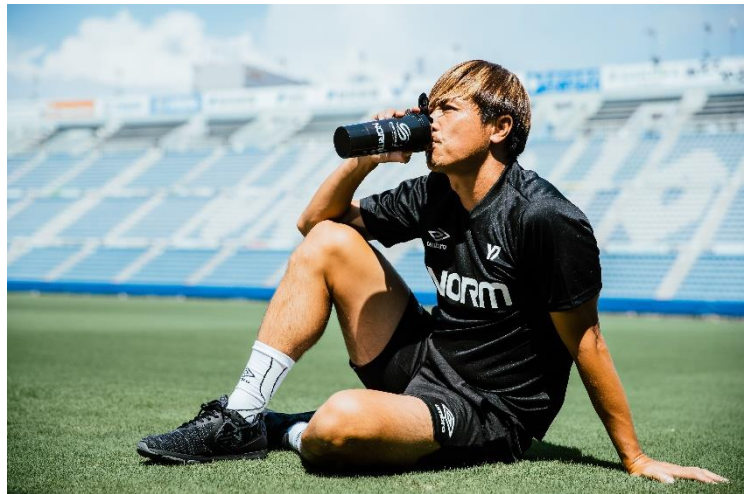
【広報用画像：ケンブリッジ選手画像】