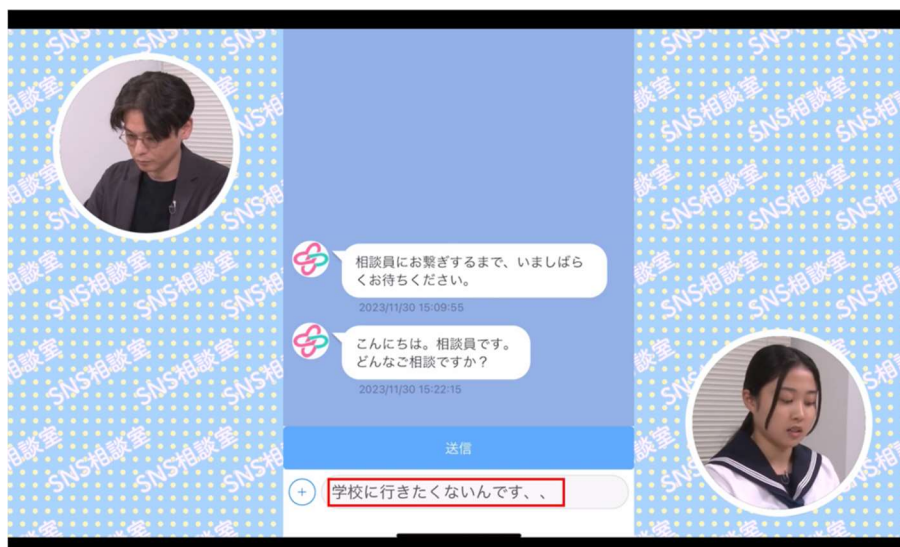
後半の解説編では SNS 相談で相談する方法も具体的に解説しています

本教材のお申込み、お問い合わせ先 : https://ace-npo.org/wp/archives/project/soschild