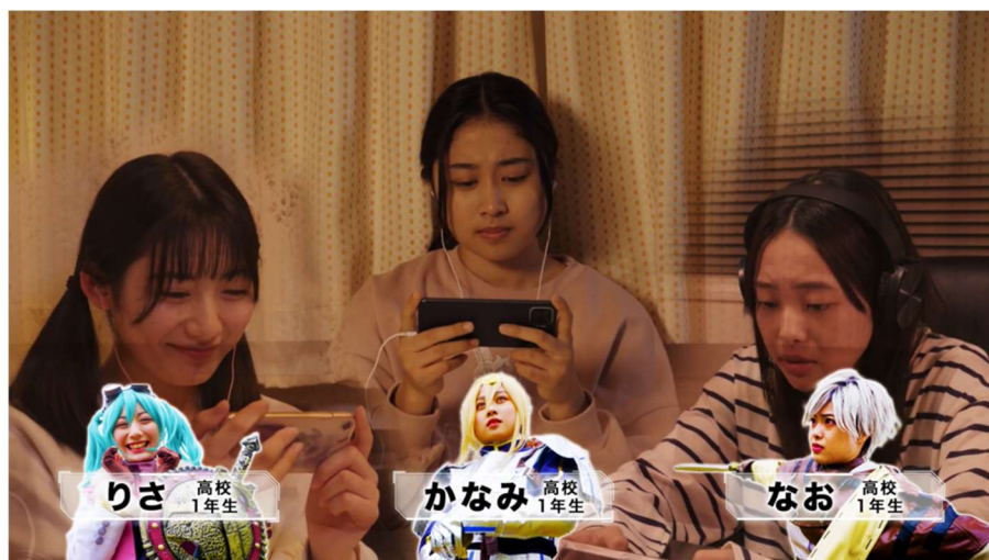
映像前半はドラマ仕立てとなっています

そのような背景より、SNS 相談などに自身でアクセスしやすい中高生を対象に、もやもやとした気持ちや小さな悩みも気軽に相談してもらいたいと、SNS など相談窓口の多様化や、窓口利用の具体的なイメージを学ぶ中学生高校生（以下中高生）向けのドラマ映像教材「三人の憂者の物語～相談で救われる未来～」を、エースチャイルドと企業教育研究会にて共同開発しました。また、その映像教材を授業として多くの学校等で活用いただけるよう授業用スライド、指導案、ワークシートも作成し、映像教材と共に無償提供を開始しました。