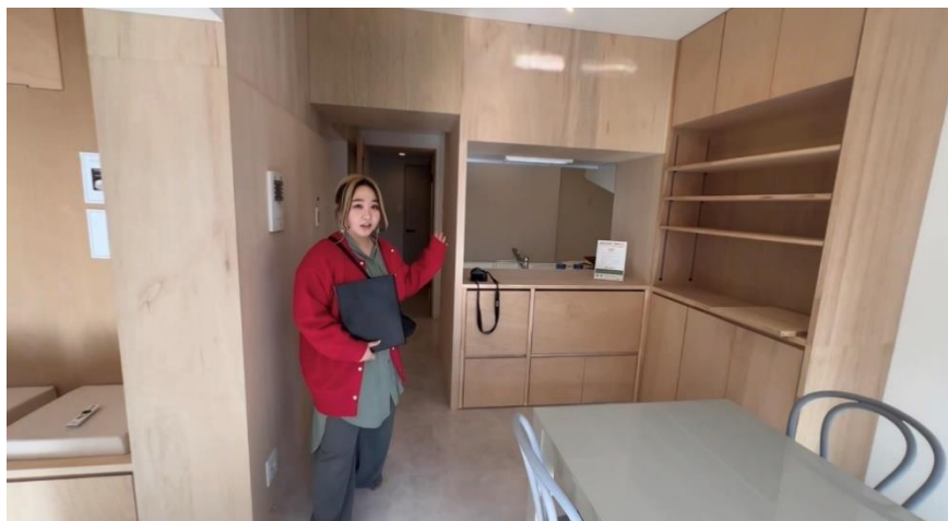
省エネ ECO 断熱施工例「グランドメゾン本山」

2016年より断熱リノベーションに取り組んできたリアルオリジナル省エネリノベーションです。省エネ化により光熱費を削減し、ECOでありながら快適に暮らせる断熱住宅となっています。