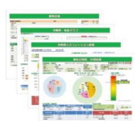
温熱計算結果イメージ

施工前に住宅の状態を確認して温熱計算を行い、改修に必要な内容を調べた上でリノベーションを行います。温熱計算と熱交換式換気システム、内窓（インナーサッシ）、高効率エアコン、断熱材（注 2）が「エコキューブ」の標準仕様となります。改修前後の温熱計算を行うため、数値で向上した性能を見ることが可能です。