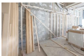
断熱施工イメージ

目視化しにくい省エネ性能ですが、「エコキューブ」では数値でご覧いただけます。温室効果ガスの削減やカーボンニュートラルの実現に向けて、ZEH 基準の省エネ性能が住宅に求められています。省エネリノベーション住宅によってカーボンニュートラルへの貢献と脱炭素社会の実現を目指し、住居費を下げながら、快適な暮らしをご提供します。