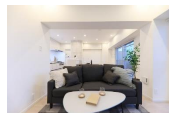
「エスポア城北」リビング