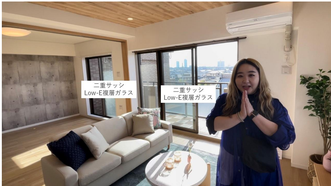
省エネ ECO 断熱施工例「ライオンズマンション東島」

断熱性能を向上させた効果は目に見えにくい部分ですが、お気軽に体感していただけるよう名古屋市内だけでなく岐阜も含めてご用意しておりますので、実際に現地でお確かめください。