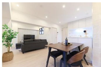
FC 加盟店物件「エスポア城北」