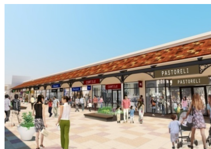
地中海リゾートをモチーフにした建物デザイン(第2期イメージ)