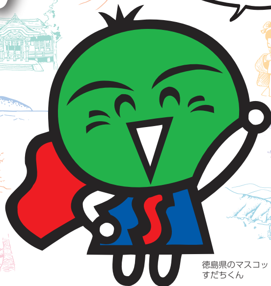
徳島県のマスコットキャラクター すだちくん