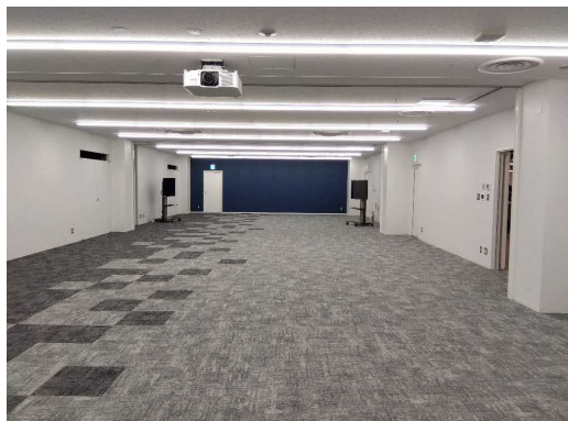
【大会議室】会議用の映像音響機材完備