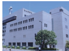
株式会社 徳島新聞社

【設立】2015年12月 【住所】徳島県徳島市 【事業内容】 タクシー配車システム開発・ 提供、タクシー会社の配車 業務受託運営サービス