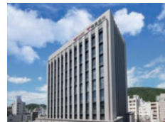
株式会社 徳島大正銀行

【設立】2023年11月 【住所】徳島県徳島市 【事業内容】 新聞の発行および、それに附 帯する事業