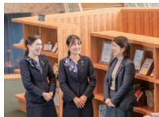
株式会社 阿波銀行