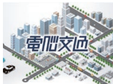
株式会社 電脳交通

【設立】2015年12月 【住所】徳島県徳島市 【事業内容】 タクシー配車システム開発・ 提供、タクシー会社の配車 業務受託運営サービス