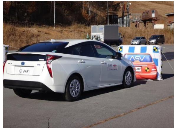
ASV体験(衝突被害軽減ブレーキ)