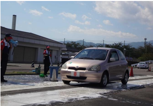
急ブレーキ体験（滑りやすい路面を擬似再現）

長い間運転されてきたベテランドライバーだからこそ、この機会に自らの運転を再確認し、今後も安全運転でカーライフを楽しんでいただきたいと思います。