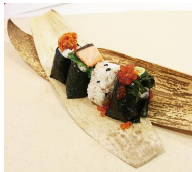
おにぎり屋 ROUTE 88