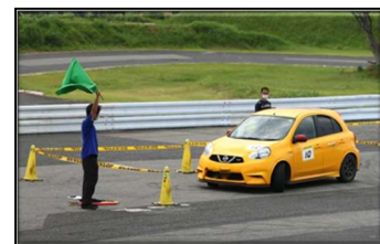
オートテストイメージ