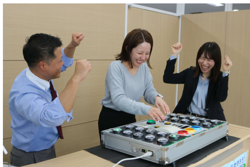
クイックアームで測定、あなたの俊敏性は何歳！？