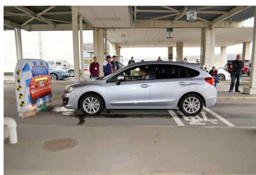
A S Vの安全性能体験

このニュースリリースに関するお問合せは、 J A F 栃木支部事業課 (☎028-659-3231 平日 9:00~17:30) までお願いいたします。