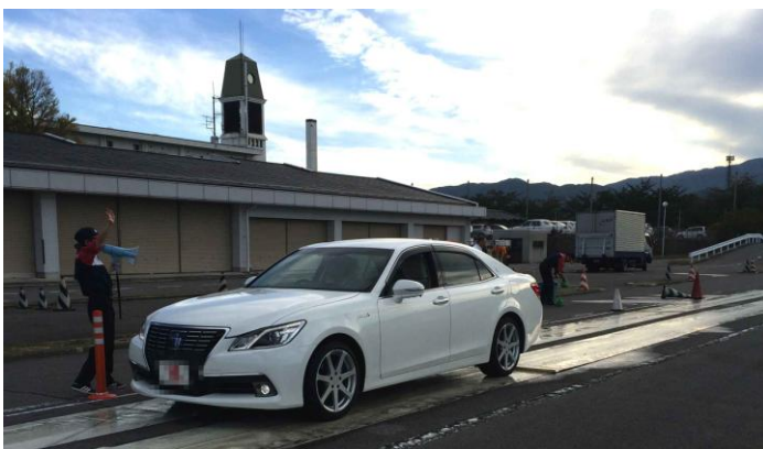
急ブレーキ体験（滑りやすい路面）