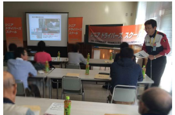
いきいき運転座学

長野県内の高齢者事故の低減を目指し2012年から4年連続で開催しており、50歳以上のベテランドライバー向けに、「長年の運転で癖づいた自己流の運転」を見直して安全な運転を考えるきっかけとしていただくためのカリキュラムです。今年は半日に集約し、20名の方に参加いただきました。