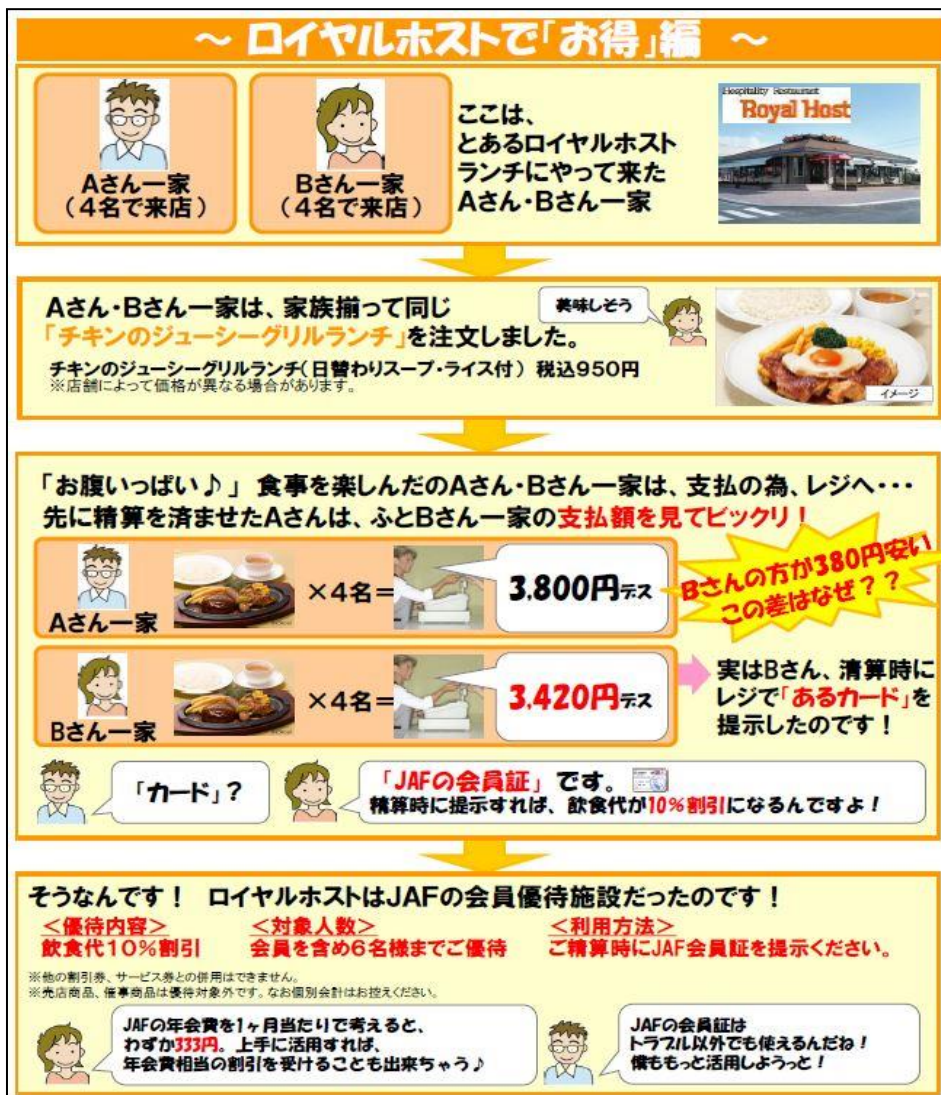
(左図) JAF会員優待施設での利用例