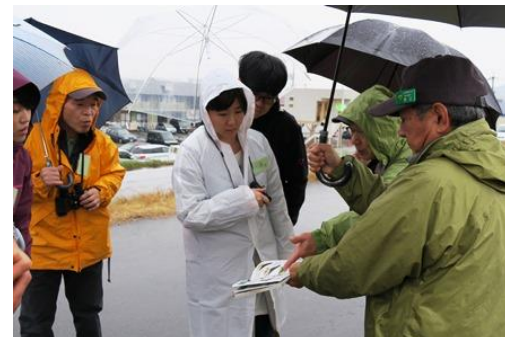
昨年の野鳥観察会の様子

都会の野鳥のオアシスでの野鳥観察とエコドライブ、J A F ならではのコラボイベントに、多くの皆様の参加をお待ちしております。