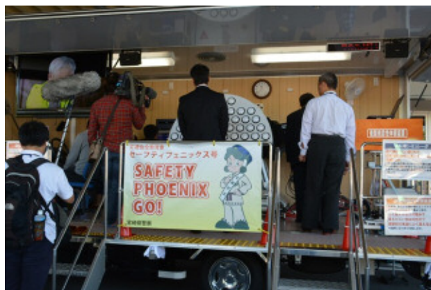
《交通安全教育車セーフティフェニックス号》