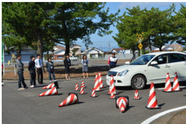
《運転の基本・死角》